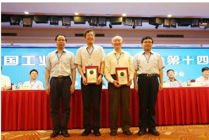
颁奖现场（右二为应隆安教授）

中国工业与应用数学学会第十四届年会于 2016 年 8 月在湘潭大学举行。大会颁发了第六届苏步青应用数学奖，北京大学数学科学学院应隆安教授和中国科学院数学与系统科学研究院袁亚湘院士获此殊荣。在 8 月 12 日上午举行的开幕式上，中国工业与应用数学学会理事长，全国人大常委会委员、副秘书长郭雷院士和湖南省人大常委会副主任谢勇为获奖者颁奖。