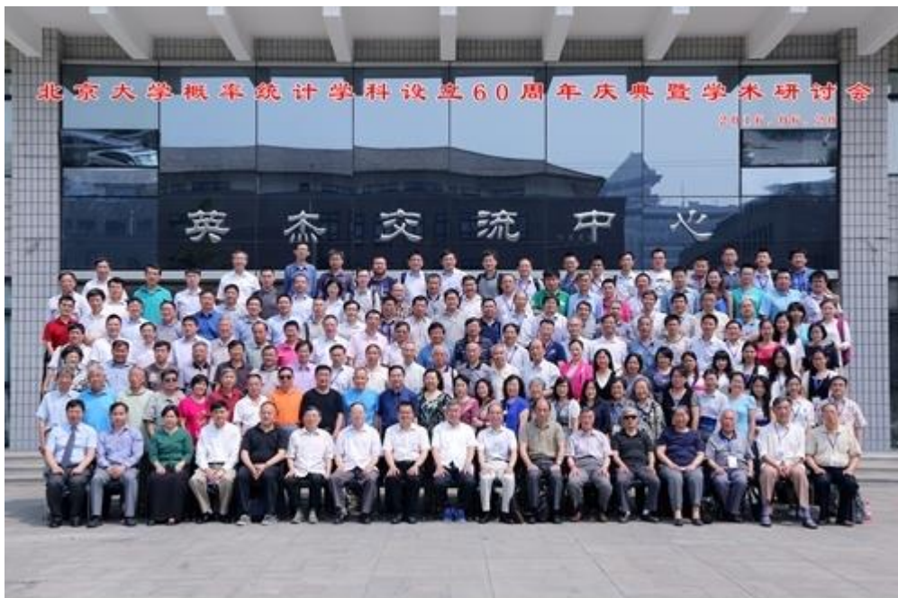
北京大学概率统计学科设立 60 周年庆典暨学术研讨会合影