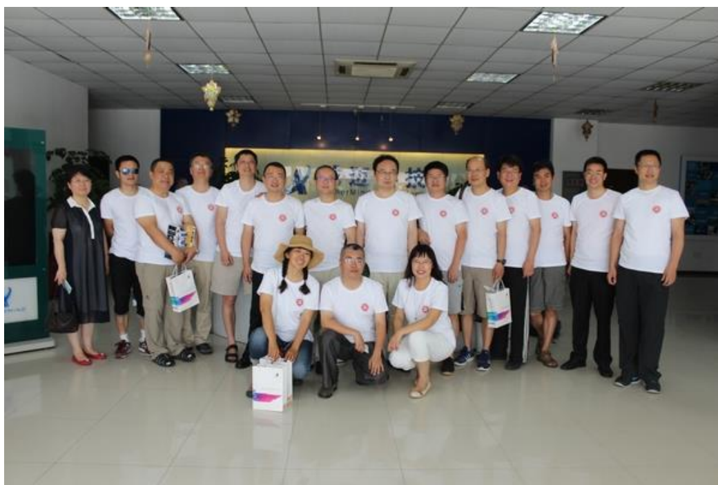
八七级部分同学合影

北大数学 87 的短暂的聚会结束了。距离可能阻碍相见，忙碌可能减少联系，时间可能模糊记忆，可再少的相见、再淡的记忆也割不断 87 数学的情感纽带，只要提到 87 数学，我们的心便连在一起。